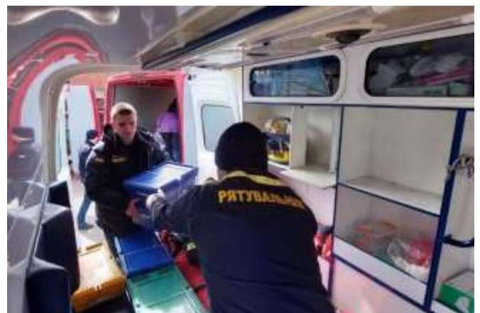
＜車から荷物を下ろす消防士たち②＞