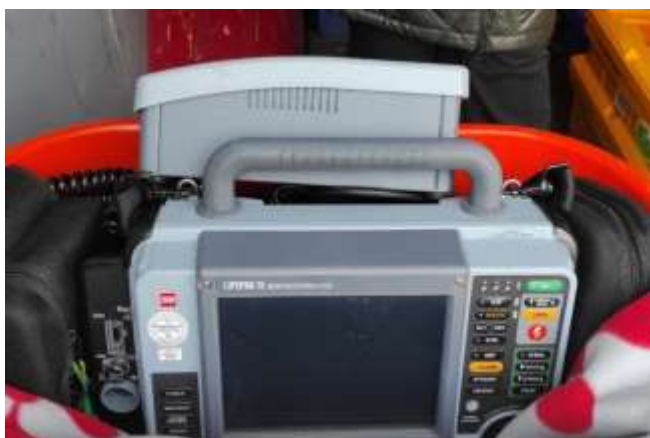
＜ポータブル除細動器(救急車で使用)＞