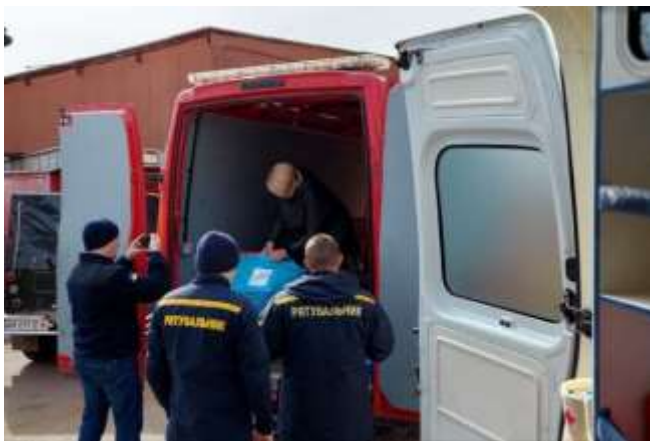
＜車から荷物を下ろす消防士たち①＞