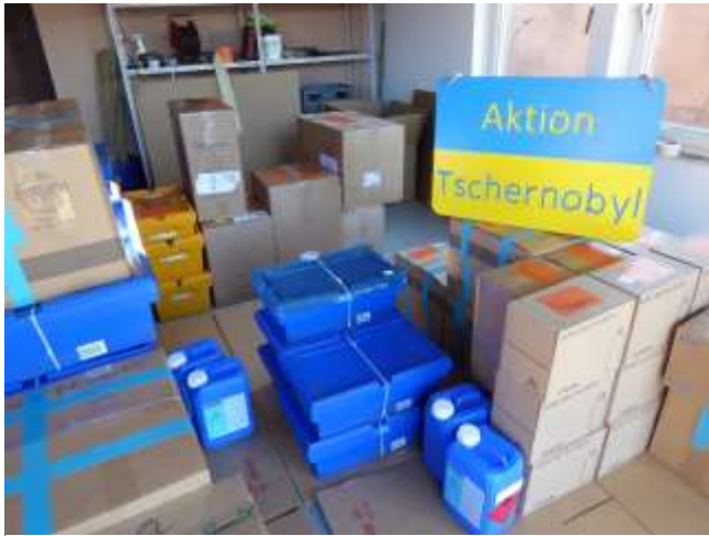
＜出発前のアクション・チェルノブイリと貨物(900Kg)＞

ドイツ（バイエルン）を出発前の「アクション・チェルノブイリ」と貨物（900Kg）