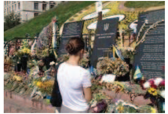
<キエフ・マイダにて(2014.09)>

2014年は、独立・自立した国家としてのウクライナにとって、大きな試練の年となりました。私たちの国民としての自覚、そして世界に対してのみならず、まず自らに対して、私たちは自立しており、豊かに繁栄できる国だと証明する能力を試されているのです。私たちは、汚職や官僚の専横のない、民主的な社会に暮らしたいと思っており、透明な課税と公正な裁判を求めています。これらすべては、過去から私たちに残されたものですが、人はいつも新たな進歩した将来に目を向け、それに向かって努力するものです。