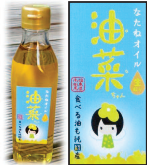
¥1,000/300ml と ¥2,500/900ml の 2 種類販売（ともに税別）

☆第 8 次放射線量率測定作業を、10 月 18~19 日、25~26 日の延べ 4 日間実施します。今回も、南相馬市と浪江町全域の測定を実施する予定です。現地集合のボランティアは、まだ若干名余裕があります。ご連絡ください。測定マップは 12 月初旬には発表する予定です。