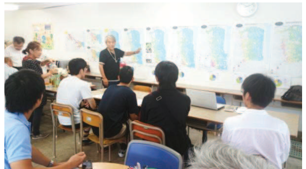
<広島県の高校生が視察に訪れました。