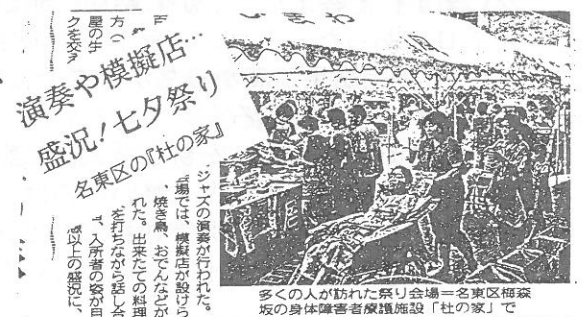
多くの人が訪れた祭り会場＝名東区梅森坂の身体障害者療護施設「杜の家」で

ジトミルから持ち帰ったアントニークさんお勧めのウォッカは、白樺の芽のエキス入りのアロマティックなウォッカで、なかなか美味しいと評判でした。(美)