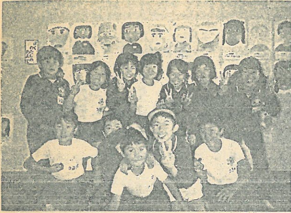
写真 岐阜県神岡東小学校の3年1組の皆さん